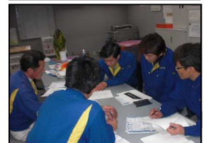
埼玉県深谷市「アドニスファクトリー」にて実施致しました